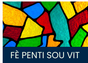
FÈ PENTI SOU VIT